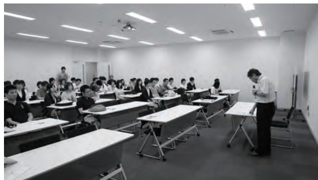
表彰式：優秀賞選定に際しての審査員講評風景