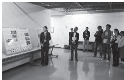
研究発表会、 ポスターセッション風景

平成24年度の「研究発表会・懇親会」は、10月27日(土)に九州大学大橋キャンパス(芸術工学部)で開催されました。発表件数は、口頭発表29件・ポスター発表2件の合計31件、学生作品発表4件でした。3会場同時進行の9つのセッションがあり活発な議論が交わされました。参加人数は72名と23年度とほぼ同数であり全体として盛況でした。また、研究発表会終了後に食堂で懇親会を開催し、40名程度の参加者を得て盛況の内に終了しました。