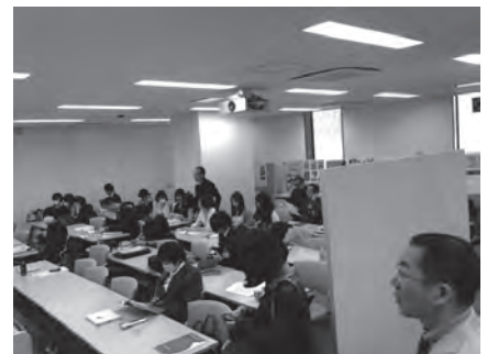
第3支部研究発表会風景