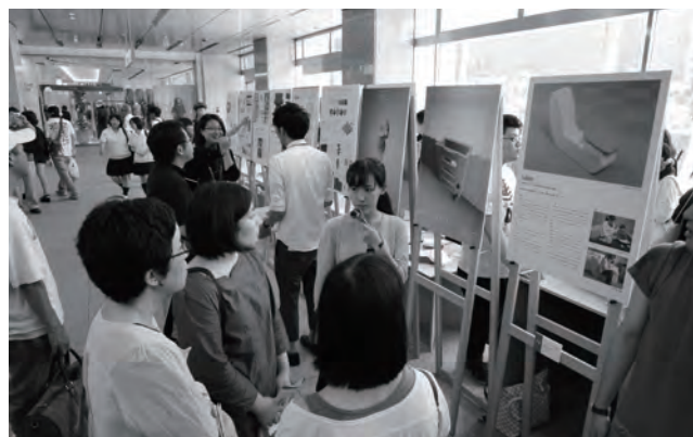
学生によるプレゼンテーション風景

以上のように、今年度の学生デザイン展では、いくつかの新しい試みを実施しました。会場の制約など今後検討すべき課題も残されていますが、デザイン教育の内容を広く市民に伝えるという目的は、達成されたと考えております。こうした結果を踏まえ、最終日に開催した支部会において、次年度も継続して実施する方針が確認されました。