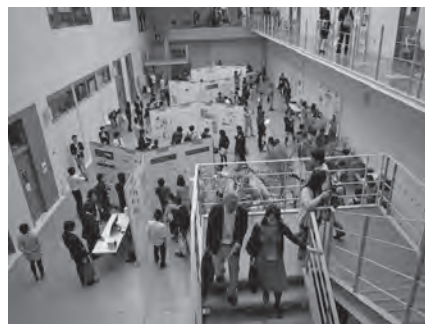
ポスターセッション風景