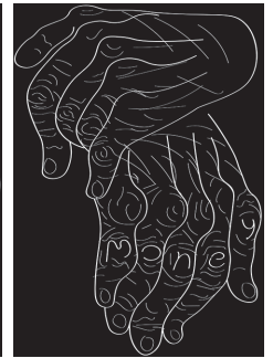
1 グランプリ 「Don't put a price tag on me」