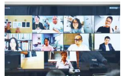
審査風景（オンライン会議ツールを利用）