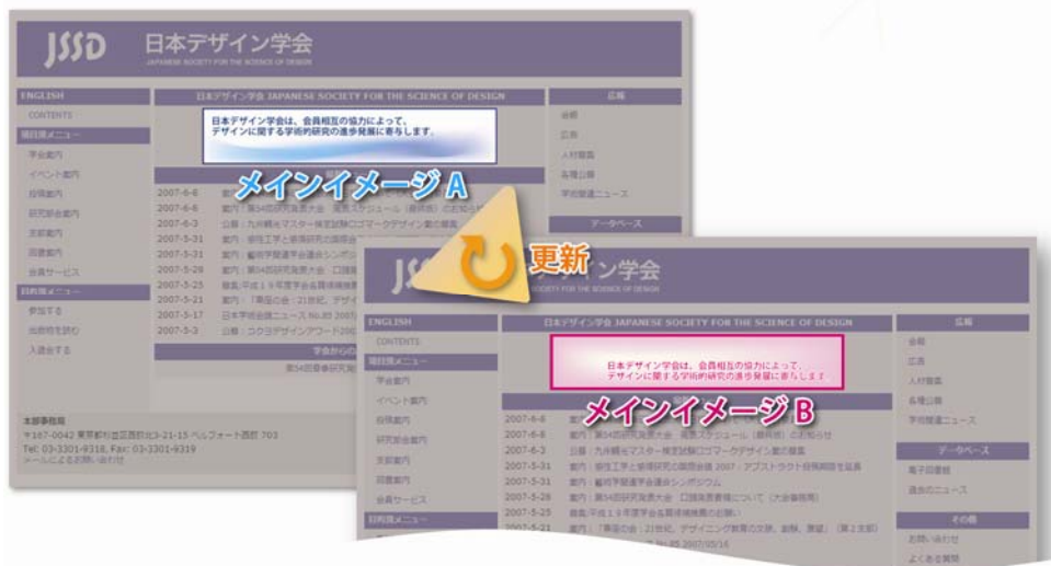
図2 ページ更新によるメインイメージの切り替え