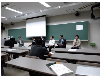
オーガナイズドセッション 「ロボットがクルマに乗った日」