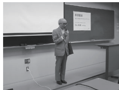
高橋靖名誉会員からのご挨拶