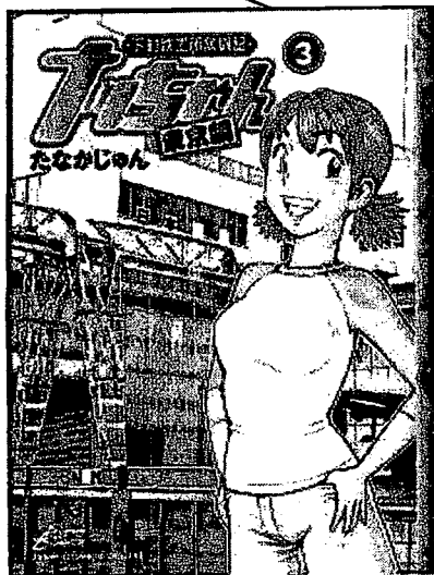
↑講師たなかじゅん氏の漫画『ナッチャン』のコミック「東京編」第3巻。 ((c) たなかじゅん/集英社)

→「ナッチャン」の等身大フィギュア。(株式会社ミナロ蔵) 各地の工業フェアなどに出展されており、ナッチャンがものづくりの現場でいかに支持されているかを物語っています。ちなみに、このフィギュアも「木型」を使って製作されています。 ((c) たなかじゅん/集英社)